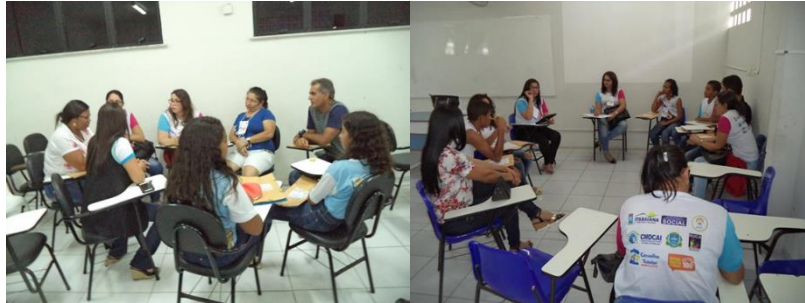
Fórum Comunitário e Oficinas de elaboração do Plano